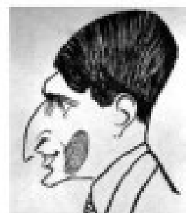
Tuwim według Jerzego Sz wajcera