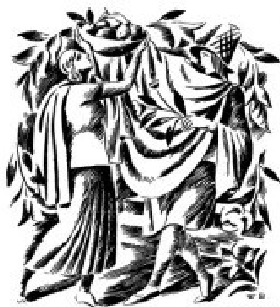
Okladka miesięcznika „Skamander” autorstwa Wacława Borowskiego (nr 16/1922)

Gazetka XXVIII Ogólnopolskiego Turnieju Sztuki Recytatorskiej i Poezji Śpiewanej im. Skamandrytów 22 listopada 2013 r. - nr 1 ( i jedyny)